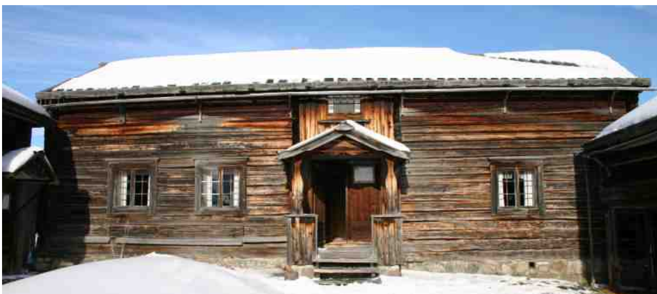
Boningshus I. På A-väggen är timret i dåligt skick till vänster om entrén, d.v.s i den södra delen av byggnaden, under och mellan fönstren.

Boningshuset uppfördes antagligen omkring 1773 (se Ullberg). På fotografier från tidigt 1900-tal har byggnaden brädtak med vattrännor, nockbrädor och stoppbrädor. Mellan parstugan och lillstugan (byggnad II) syns ett ca 2 m högt brädplank. På foton från 1917 var A-väggen klädd med lockpanel och hade hängrännor på trekantiga konsoler som täckte entrén och A-vägg mot D (se bild 3 på sidan 9). Även C och D-väggen var klädda med lockpanel. Nuvarande farstuvist (barfred) saknades på A-vägg. Byggnaden renoverades när hembygdsföreningen tog över. På byggnadsvårdslägret 2007 åtgärdades byggnaden senast. Då restaurerades bl.a. fönsterbågarna på A-vägg som antagligen är från 1960-talet. Vissa trälagningar utfördes.