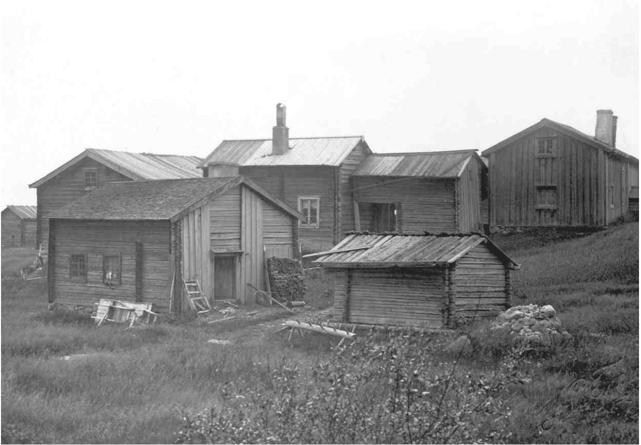
Foto av Tomtangården taget omkring 1920 från norr. I förgrunden syns vedboden till höger och bagarstugan till vänster. Ejneg 265