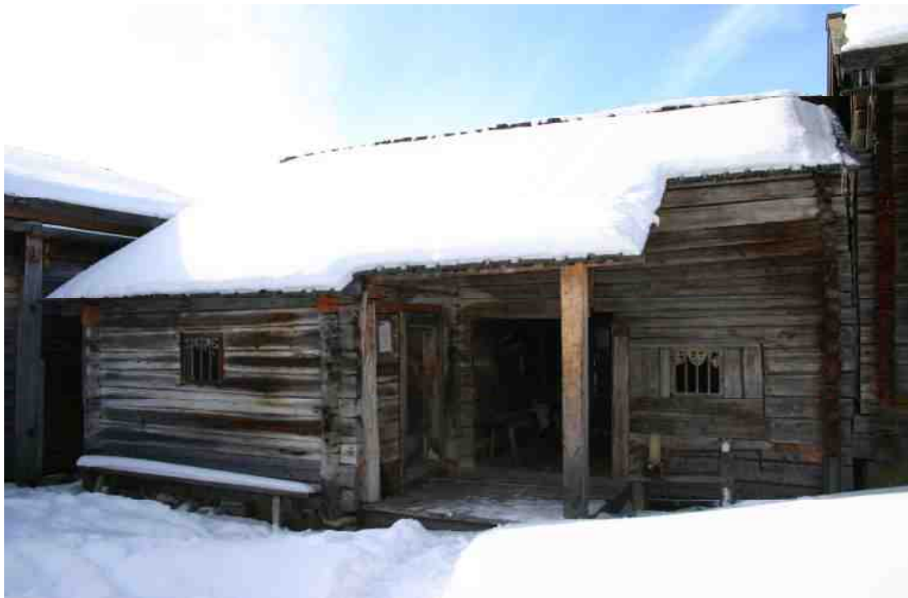
Stora stallet 2 hästar

vägen. Förändringar och förbättringar som gjorts för att underlätta det dagliga arbetet på gården är också representerade. Om man vid en förändring skulle välja en tidigare tidpunkt måste kanske vissa ”årsringar” avlägsnas för att gården ska bli en trovärdig miljö. Utan en medvetenhet om gårdens utseende vid olika tider finns det risk att allt för mycket byts ut och att det snart inte finns några ursprungliga delar som minner om hur gården såg ut när den brukades